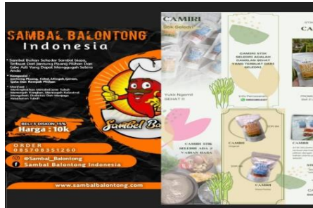
Gambar 1. Dokumentasi poster dan flyer sebagai media promosi produk mahasiswa

Oleh karena itulah menurut Jayatri (2019) lulusan kelompok terdidik diharapkan mampu menyerap tenaga kerja di lingkungan sekitar mereka melalui penciptaan usaha baru. Berikut ini contoh hasil desain mahasiswa untuk poster usaha mereka.