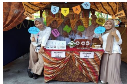
Gambar 2. Antusias mahasiswa dalam mengikuti bazar

Cuplikan kutipan wawancara di depan memberikan gambaran bahwa program program bazar mampu meningkatkan rasa percaya diri, karena bisa mengenal karakter macam-macam konsumen. Mahasiswa juga memiliki kesempatan berperan secara langsung untuk menjual produk mereka dan bertemu dengan penjual lainnya. Berikut ini dokumentasi pendukung kegiatan bazar mahasiswa.