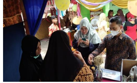
Gambar 3. Proses menawarkan produk usaha kepada pembeli.

Berikut ini dokumentasi interaksi mahasiswa dengan target kosumen mereka dalam menawarkan produk.