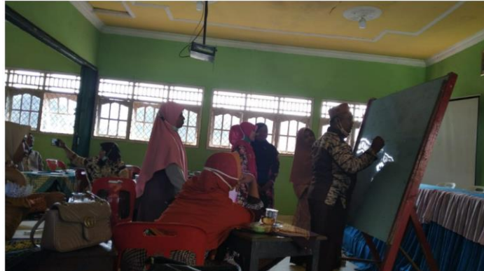
Gambar 2. Kegiatan Tahapan Edukasi dengan game

Dalam proses edukasi setelahnya dilanjutkan dengan melakukan diskusi berupa tanya jawab mengenai kurang pahamannya guru dalam menangkap materi yang disampaikan. Pada proses ini terlihat guru sangat responsive dengan aktif memberikan pertanyaan.