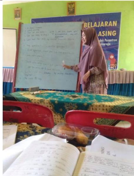
Gambar 1. Metode Edukasi dengan pemberian materi ajar Bahasa Inggris

Tujuan kegiatan ini adalah memberikan ilmu dan pemahaman terkait peningkatan kompetensi dalam berbahasa Inggris bagi para guru. Pemberian dan penjelasan materi memberikan penguatan kemampuan awal mereka untuk mampu mengimplementasikan saat proses pembelajaran didalam kelas. Metode pelaksanaan secara langsung seperti ini diharapkan peserta dapat memahami materi secara utuh. Penyampaian materi dilakukan dengan metode mini lecturing dan game . Berikut adalah gambar aktifitas kegiatan edukasi melalui game .