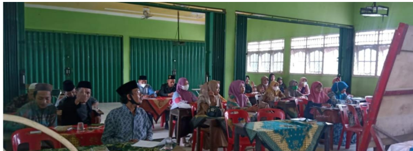
Gambar 4. Kegiatan praktik Bersama

Hasil dari pelaksanaan tahapan kegiatan ini berjalan dengan sangat baik dan lancar. Seluruh peserta bisa langsung mempraktikkan hasil pendampingan. Pengalaman dan edukasi baru diperoleh oleh seluruh peserta kegiatan yang merupakan guru yang mengajar pada unit Yayasan pondok pesantren Nurul Huda di Desa Sukaraja. Terlihat bahwa peserta mampu mengikuti kegiatan dengan aktif.