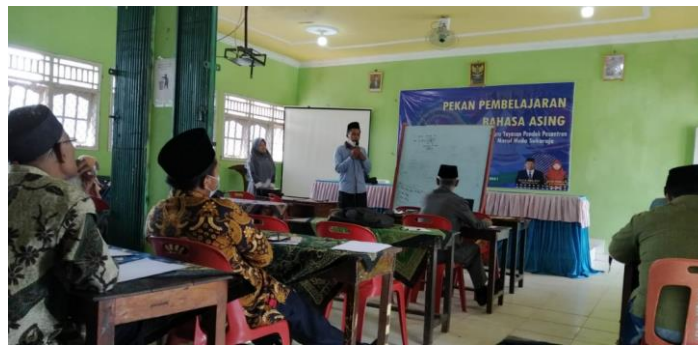
Gambar 3. Metode Diskusi dengan Q&A

Dalam proses edukasi setelahnya dilanjutkan dengan melakukan diskusi berupa tanya jawab mengenai kurang pahamannya guru dalam menangkap materi yang disampaikan. Pada proses ini terlihat guru sangat responsive dengan aktif memberikan pertanyaan.