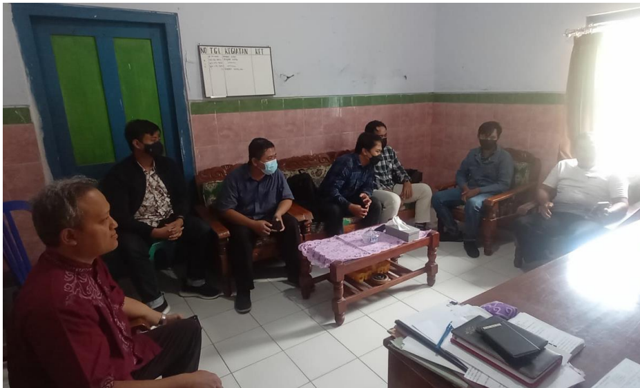
Gambar 3. Wawancara dan analisis kebutuhan website kelurahan Bendo