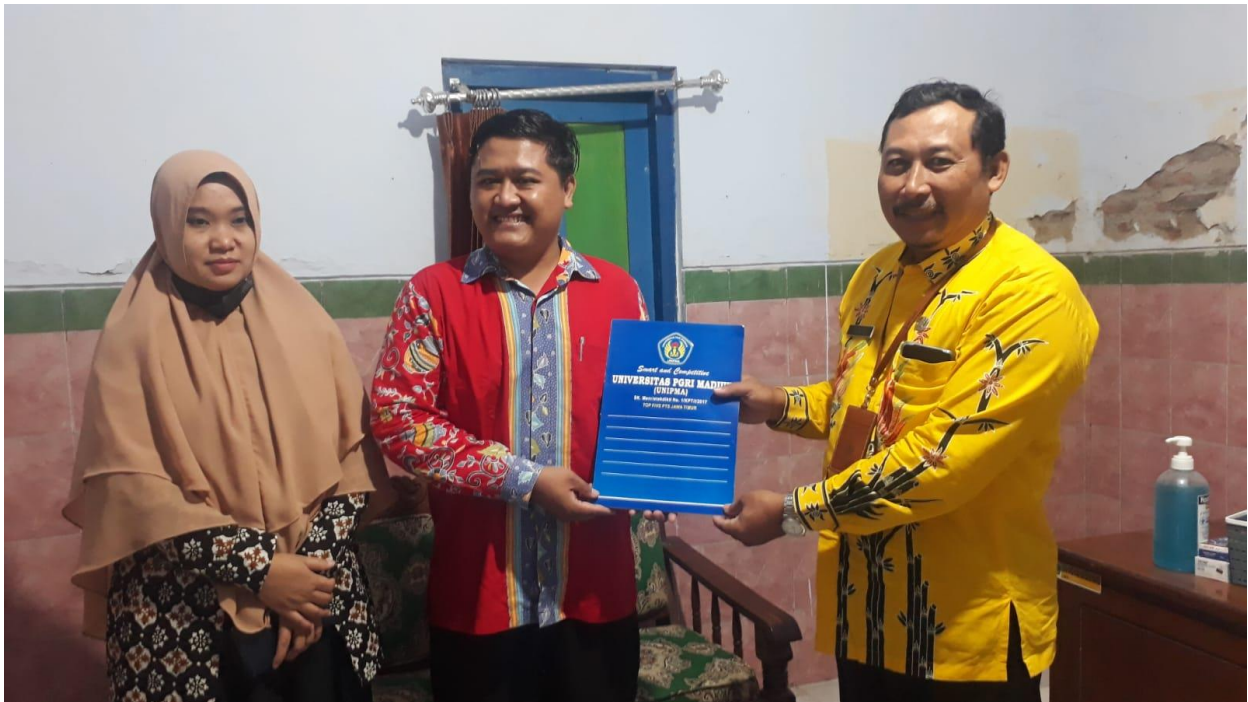
Gambar 6. Penyerahan dokumen administratif Domain dan Hosting ke pihak kelurahan Bendo