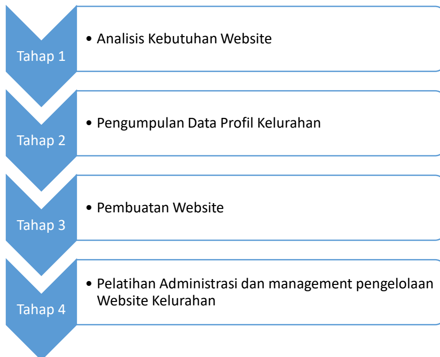
Gambar 2. Tahapan Pelaksanaan Kegiatan Pengabdian kepada Masyarakat

Pelaksanaan kegiatan Pengabdian kepada Masyarakat ini dilakukan dengan rentang waktu 5 bulan (April – Agustus 2022 ) dapat dilihat pada gambar 2 yang memiliki 4 tahap kegiatan yaitu analisis kebutuhan website, pengumpulan data profil kelurahan, pembuatan website, dan pelatihan administrasi serta management pengelolaan website kelurahan. Susunan dari tim pelaksana kegiatan Pengabdian kepada Masyarakat terdiri dari 5 orang yang merupakan 3 tenaga dosen yang bertugas untuk melakukan observasi, analisis data, membuat konten dari website, melatih perangkat kelurahan dan Menyusun laporan kegiatan pengabdian, yang dibantu oleh 2 mahasiswa dalam proses pembuatan dan melakukan pelatihan pengelolaan website.