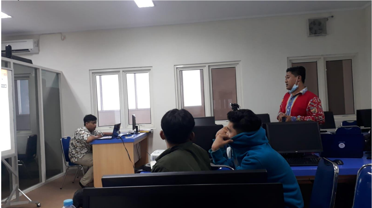
Gambar 5. Suasana pada saat pembuatan website Kelurahan

Pada tahap 3 dalam gambar 5 , tim membangun website kelurahan bendo dengan konsep yang dibuat berdasarkan Analisa kebutuhan yang telah di lakukan oleh tim pada tahap 1 dan sesuai dengan data – data kelurahan Bendo yang telah tim peroleh dari pengumpulan data pada tahap 2.